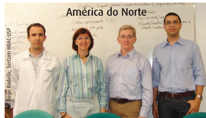
América do Norte

As ações de internacionalização marcaram intensamente o ano de 2012 no HRAC-USP. Pesquisas multicêntricas, intercâmbios científicos e visitas técnicas movimentaram a rotina de profissionais e alunos da instituição. Veja, nesta última edição do ano, algumas dessas atividades que incluíram gente de quase todos os continentes do Globo.